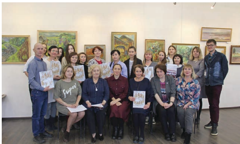
Презентация книги комиксов «Дневники Кылдысина» в Республиканском методическом объединении преподавателей детских художественных школ и художественных отделений детских школ искусств Удмуртской Республики