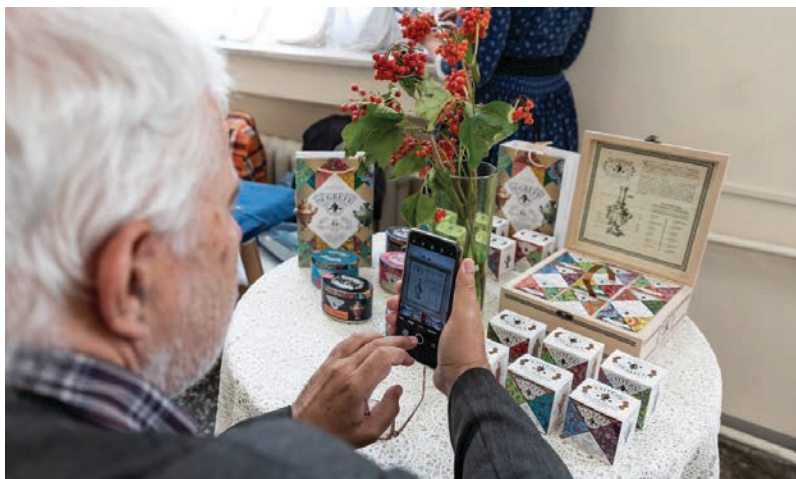
На встрече с этножурналистами в Российском этнографическом музее