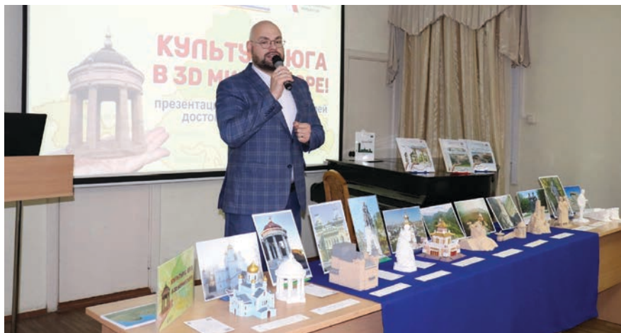
Тифлоэкспедиция «Культура России – прикоснись и увидишь»