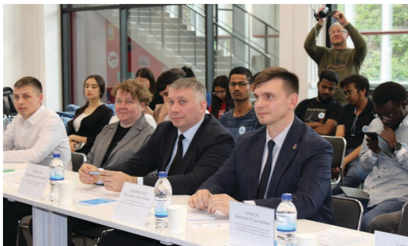
Аппарат ATK и эксперты