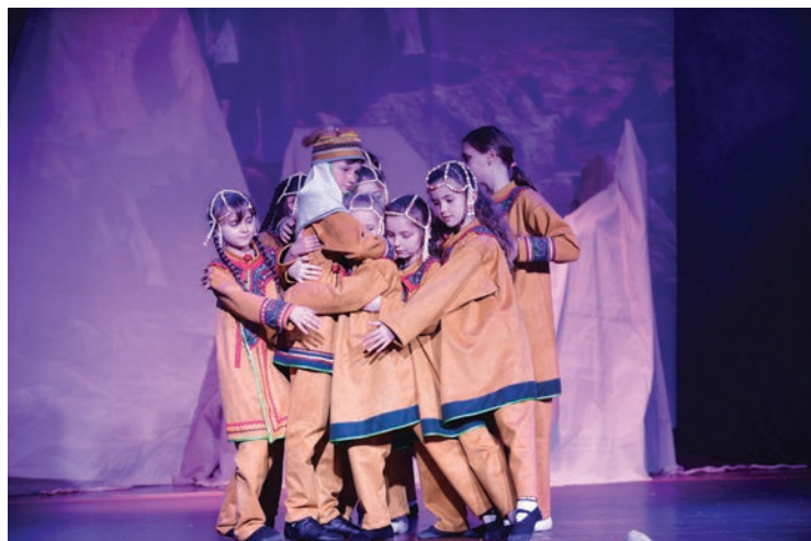
Танцевальный спектакль «Легенды Приморского края», сцена «Встреча». Танцевальный коллектив «Эста»