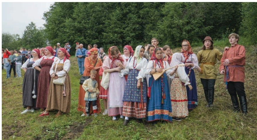
Фольклорная студия Матица (г. Череповец Вологодская обл.)