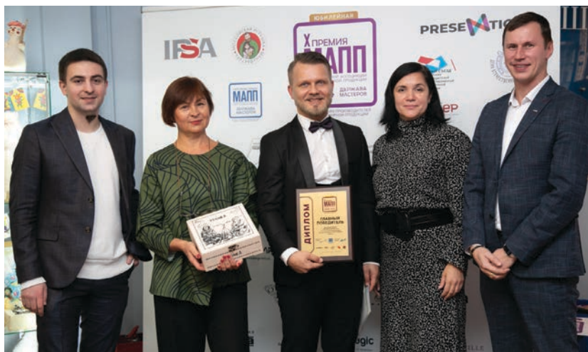
На церемонии вручения призов Международной Ассоциации Презентационной продукции