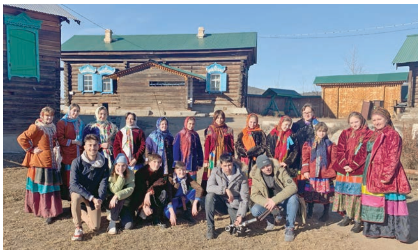
Съемочная группа «По регионам!» в с. Тарбагатай. Знакомство с бытом и культурой семейских старообрядцев