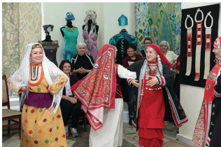
Фольклорное представление «Кейез басыу омэхе» народной студии башкирского национального костюма «Селтэр» на открытии фестиваля «Войлокфест»