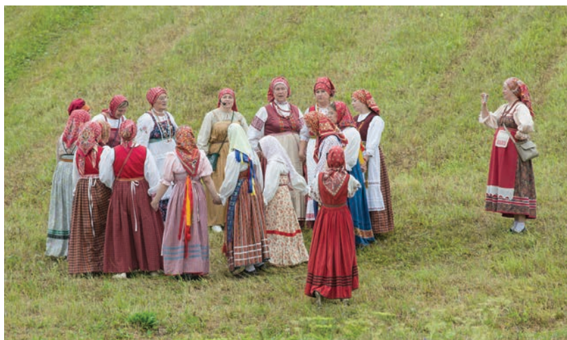
Макарьинские пожни. Хоровод