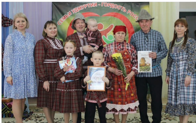
Семья Кабановых, представители удмуртской национальности, родом из Малопургинского района Удмуртской Республики