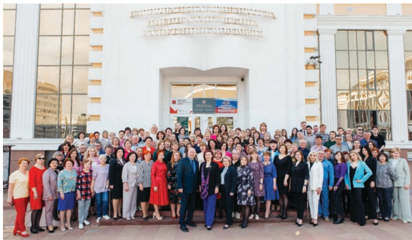
Коллектив Национальной библиотеки им. А. С. Пушкина Республики Мордовия