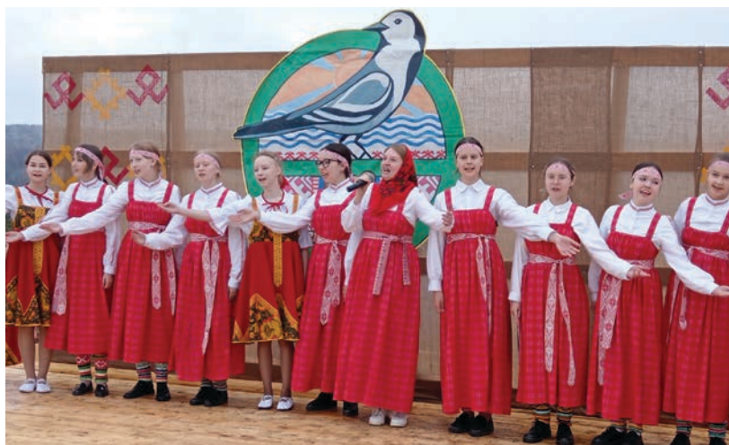
Коллектив Детской школы исполняет песню на коми-язьвинском языке