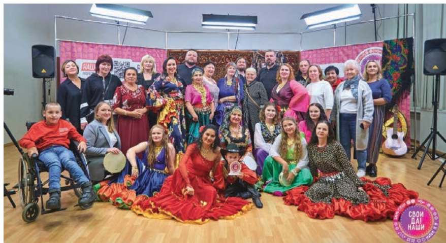
Встреча с представителями цыганского народа