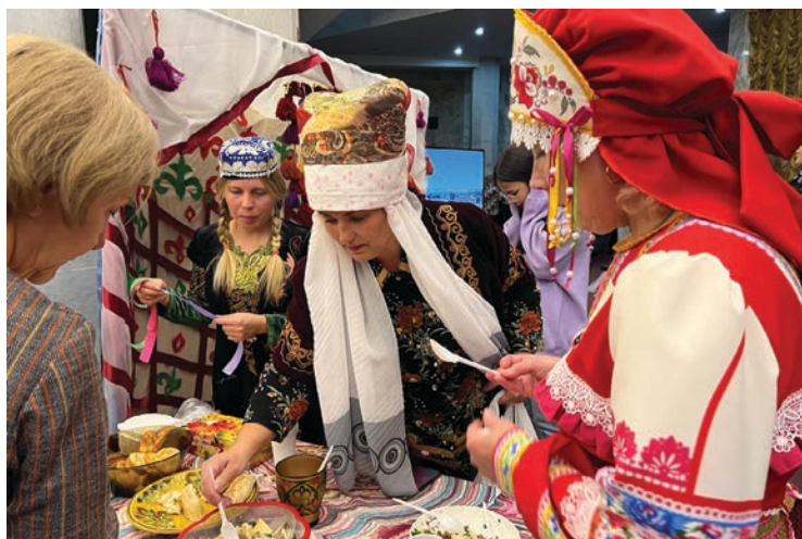
Участники форума «Первый дальневосточный этноконфессиональный семейный форум»