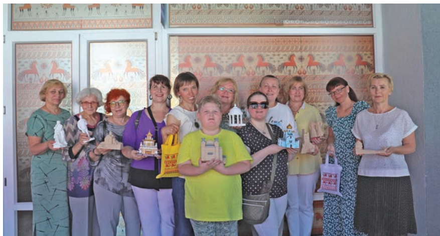
Экспозиция «Культура Юга в 3D-миниатюре» на площадке Молодёжного центра