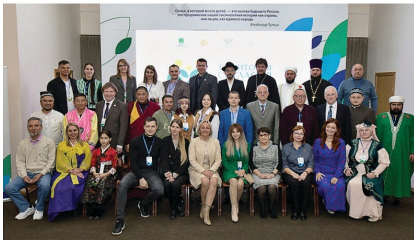
Открытие «Первого дальневосточного этноконфессионального семейного форума»