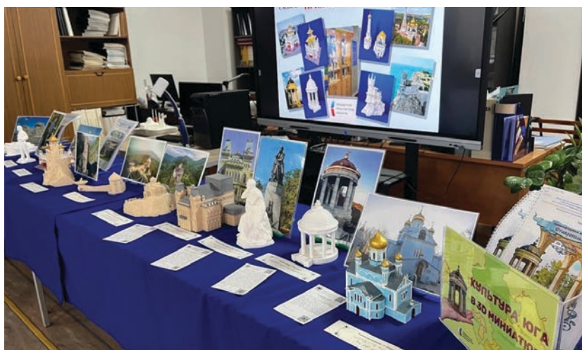
Экспозиция 3D-копий архитектурных и скульптурных брендов Ставропольского края и южных регионов России «Культура Юга в 3D миниатюре»