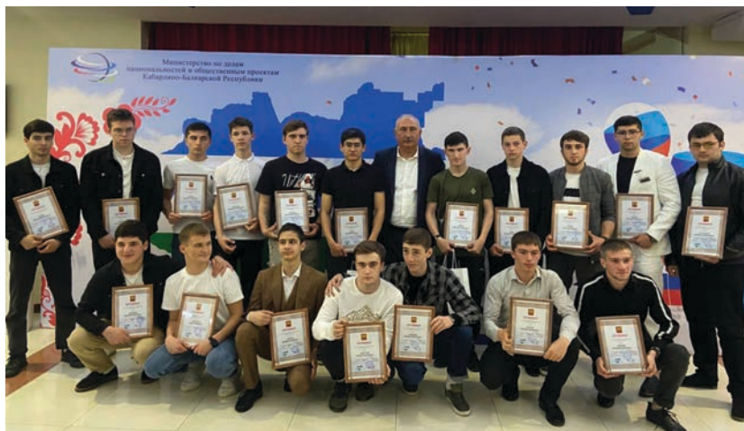
Участники молодёжного проекта «Куначество»