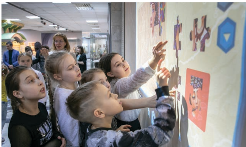
Презентация карты ЦЕЛЬНЫЙ СУРГУТ