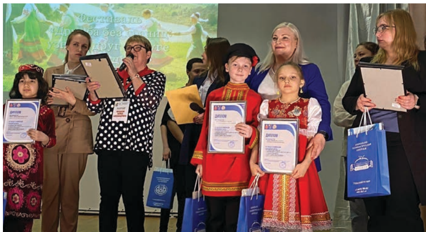
Награждение победителей и призёров конкурса эссе «Свои: единство разных»