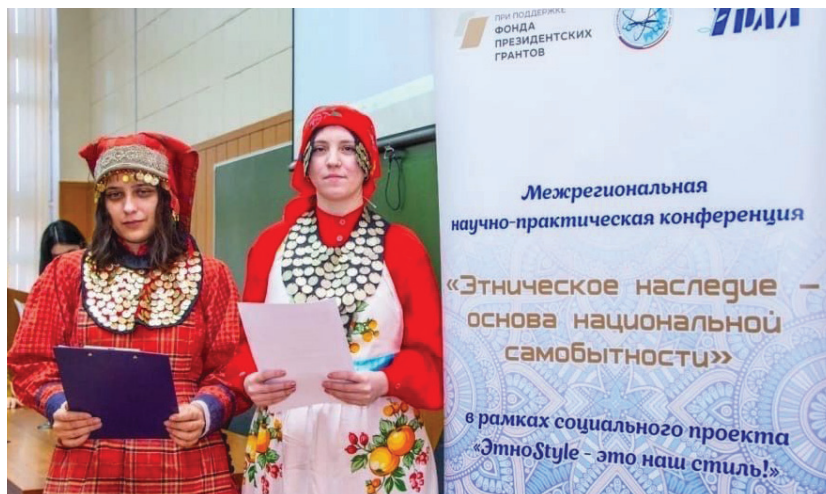
Межрегиональная научно-практическая конференция