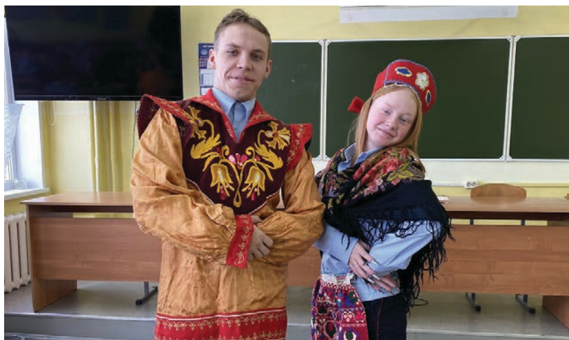
«Уроки дружбы» в Межрегиональной детской общественной организации «Юный друг закона»