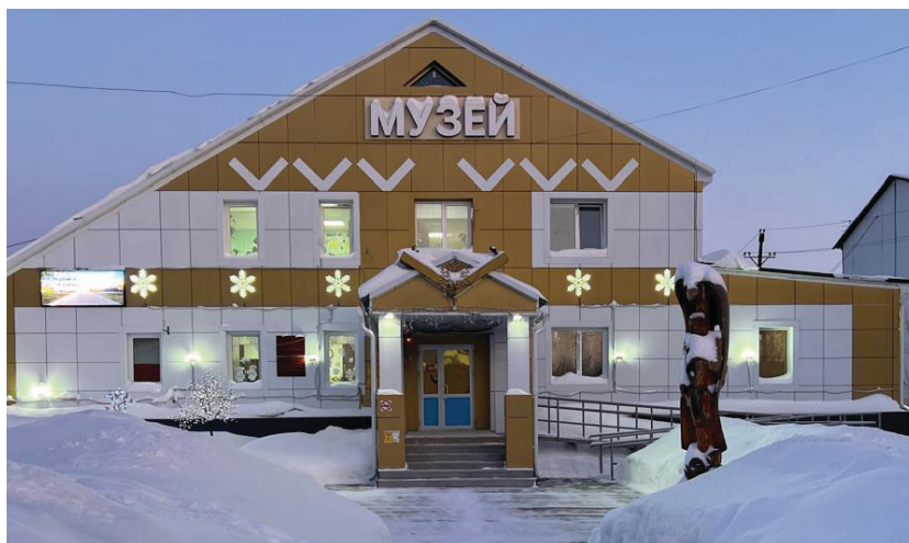
Музей села Красноселькуп