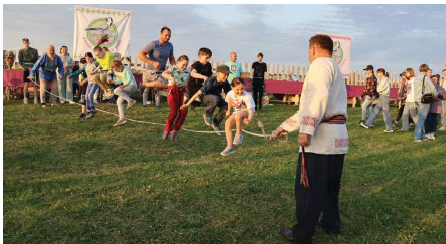
Народные забавы на коми-язьвинском обрядовом празднике «Сарчик приносит весну»