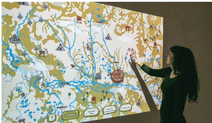
Карта земли Сургутской

УФО, Ханты-Мансийский автономный округ — Югра, г. Сургут