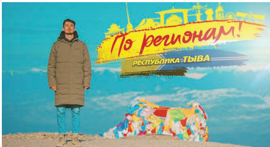
Выпуск тревел-шоу «По регионам!». «Тыва – самая загадочная республика России»