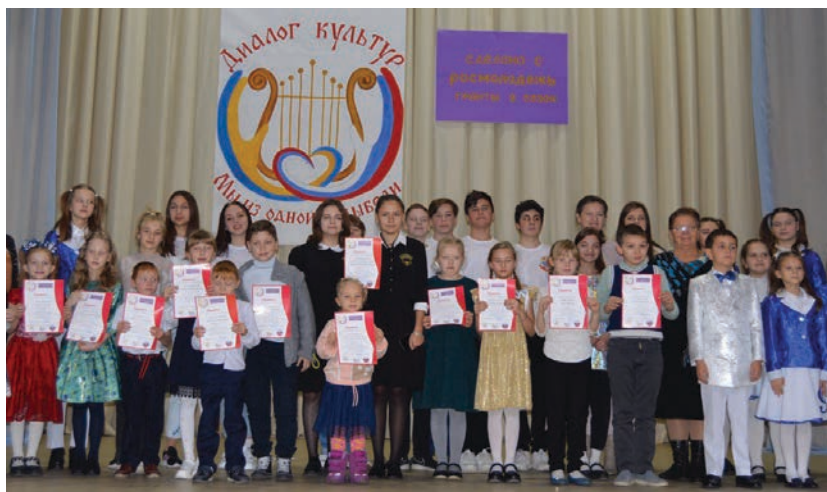
Победители конкурса чтецов «Любимые стихи=Улюблені вірші»