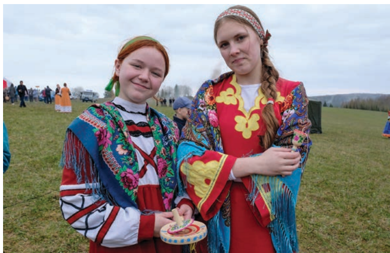
Молодежь на празднике «Сарчик приносит весну» активно организует площадки и принимает участие в народных играх