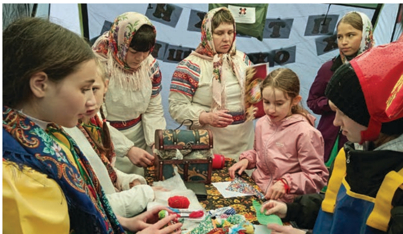
Дети и молодежь постоянные участники праздника «Сарчик приносит весну». Мастер-класс по изготовлению куклы оберега