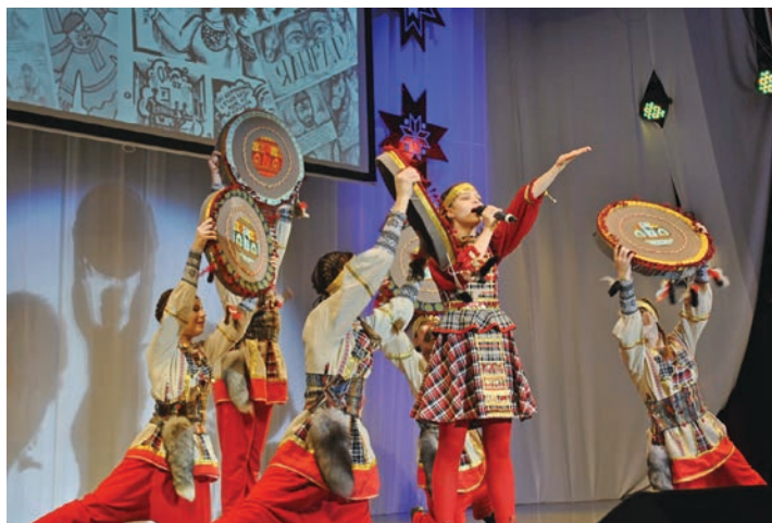
Выступление эстрадной студии «Радуга Успеха» на презентации книги комиксов «Дневники Кылдысина» в г. Глазов