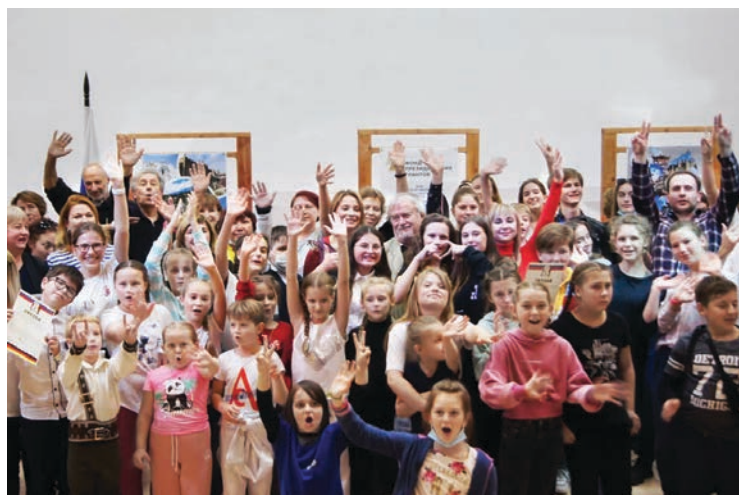
Счастливое завершение фестиваля