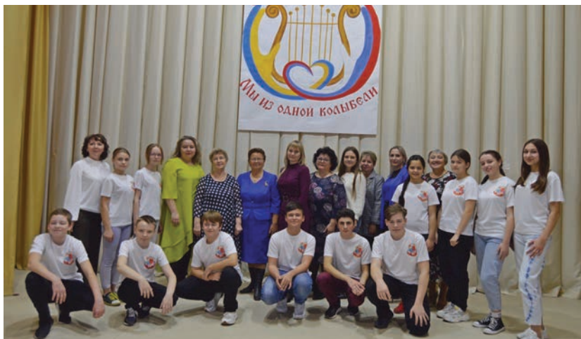
Команда проекта «Диалог культур «Мы из одной колыбели»