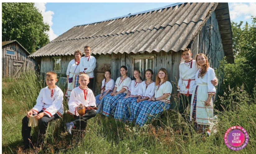
Съемки Межрегионального фестиваля вепсской культуры «Древо жизни»