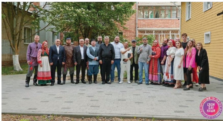
Встреча с вологодским казачеством