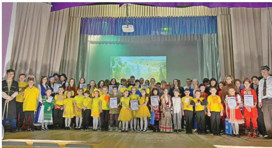
Фестиваль «Дружба без границ: узнаем друг о друге друг от друга»