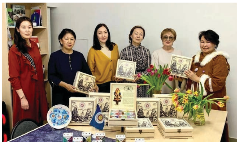
На встрече актива Санкт-Петербургского регионального отделения Ассоциации коренных малочисленных народов Севера, Сибири и Дальнего Востока РФ