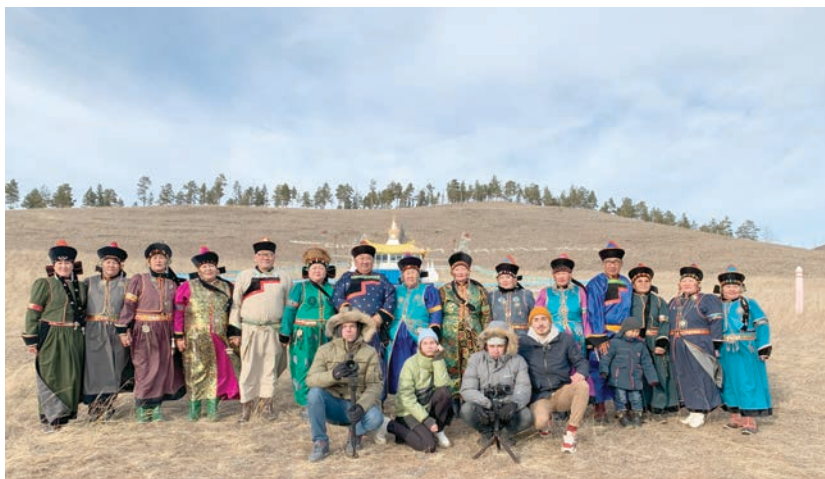
Команда тревел-шоу на съемках выпуска «Бурятия, которая вас удивит»