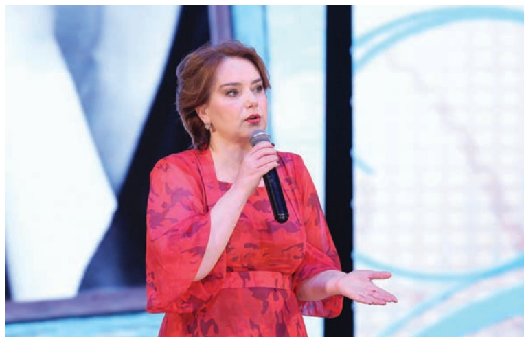
Спикер Форума - Ольга Будина, общественный деятель, российская актриса театра и кино, телеведущая, лауреат Государственной премии России