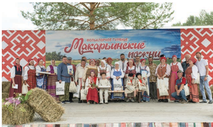
Награждение участников Турнира косарей