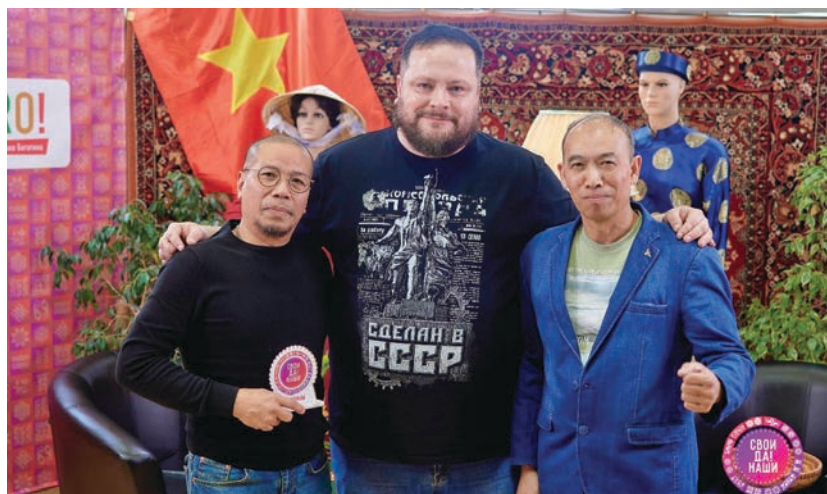
Встреча с представителями вьетнамской общины Вологодчины в рамках проекта «Свои да наши»