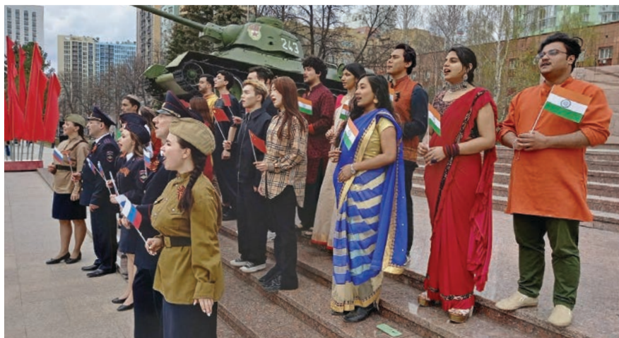
Съемки в клипе «Катюша»