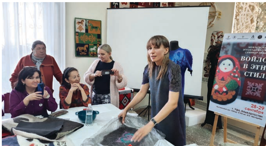
На мастер-шоу Межрегионального этнохудожественного семинара-практикума «Войлок в этностиле»