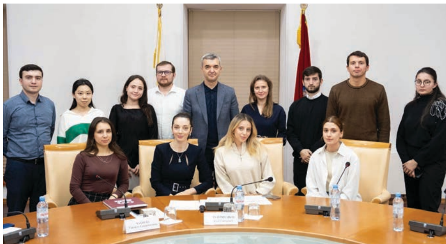
Участники «Конкурса научно-публицистических работ молодых исследователей»