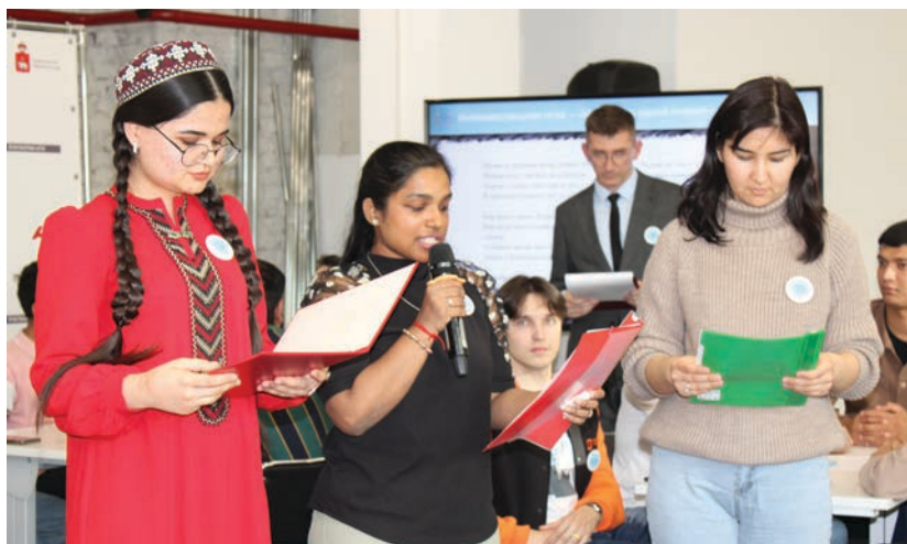
Стихотворение про Беслан