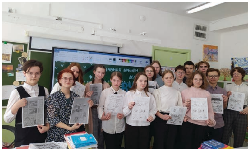
Участники конкурса переводов с русского на английский язык в проекте «Дневники Кылдысина»