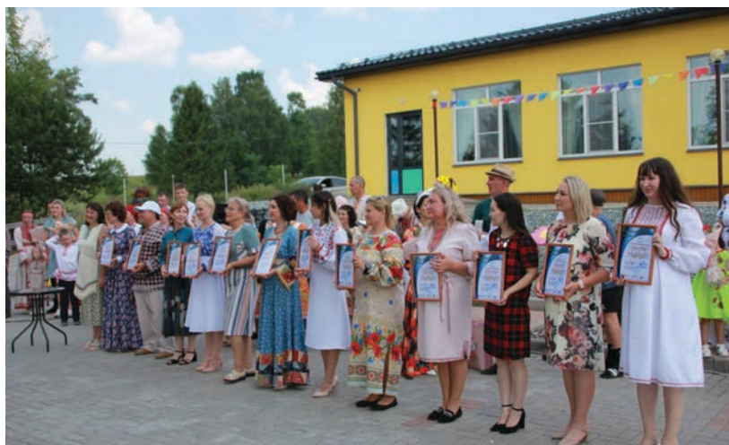
Команда проекта «Фестиваль семей «Семьи Удмуртии-гордость России»