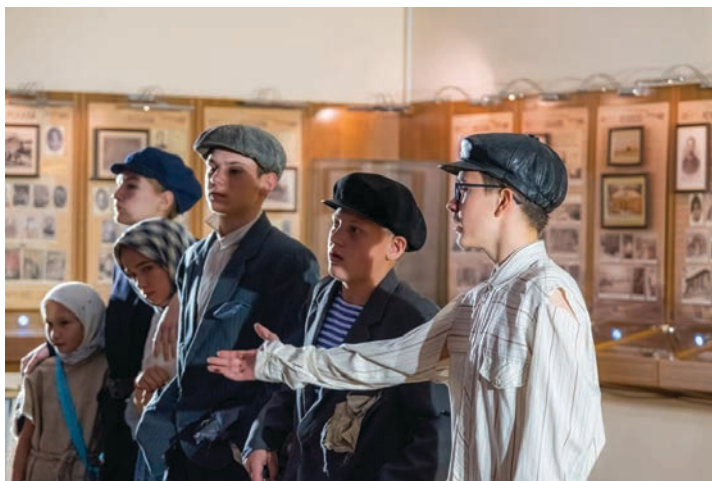
Народные дипломаты г. Новосибирска и г. Бишофсверда (Германия). Спектакль «Республика ШКИД»