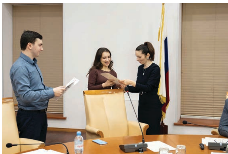
Вручение сертификатов участникам конкурса