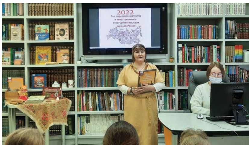
Торжественное открытие проекта «Сказочное ожерелье России»