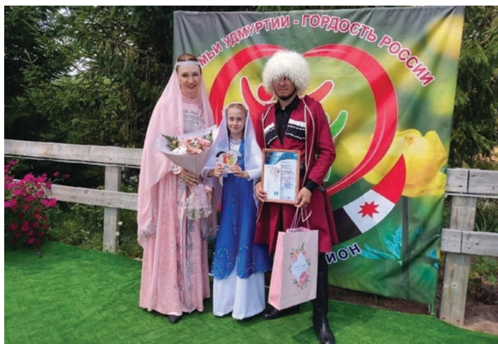
Семья Булгучевых из Сарапульского района Удмуртской Республики – представители ингушской национальности