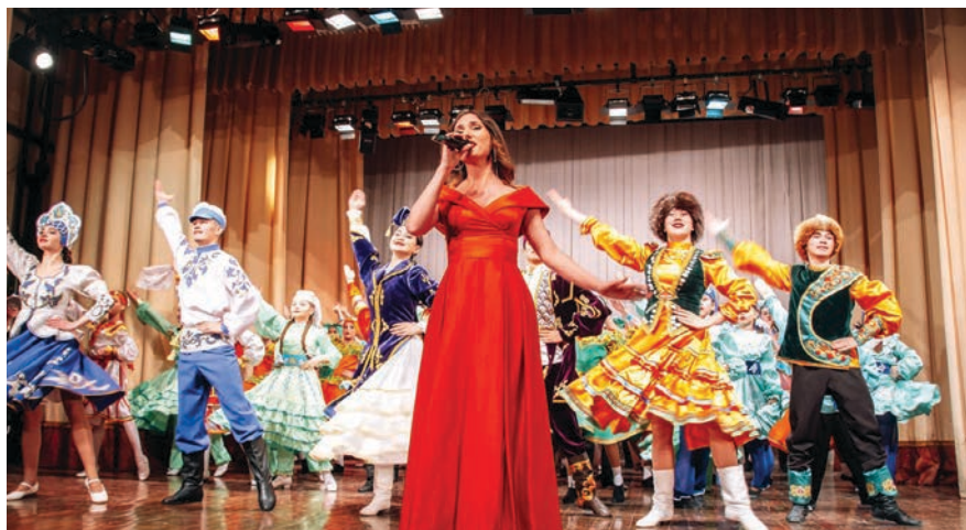
Хореографический фестиваль «Хоровод дружбы»