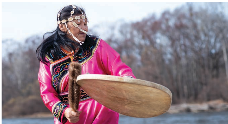
Представительница Общины коренных малочисленных народов «Тигр»