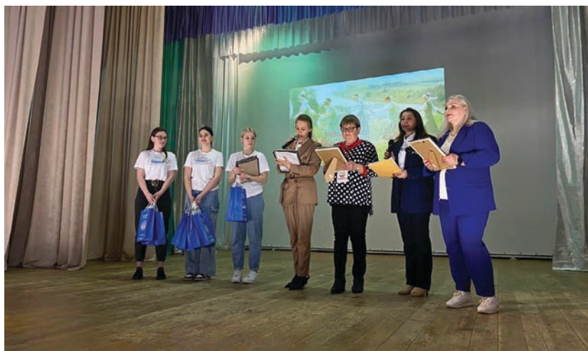
Подведение итогов проекта «Свои: единство разных»